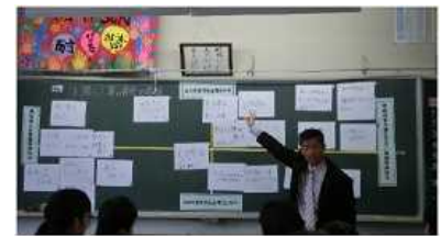
個人の意見を書いたホワイトボードを黒板に掲示（見える化）