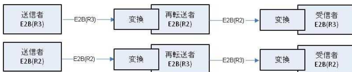
図 2 : 再転送の使用事例

このような場合、変換において、できる限りデータの完全性を保証しなければならない。すなわち、情報の消失がわずかであることが求められる。再転送者によって情報が更新される場合を除き、理想的には最初のメッセージと転送されるメッセージは内容に関して同一であることが必要である。