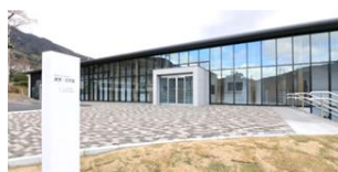
連携・交流館 (オープンラボ)