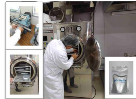
オープンラボでの試作