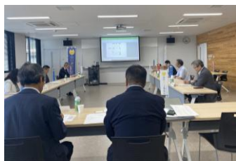
県補助制度審査会

(事業費上限500万円) 施設、機器整備 県3/10以内 (事業費上限2,000万円)