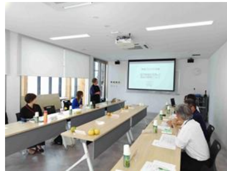
プロジェクト会議