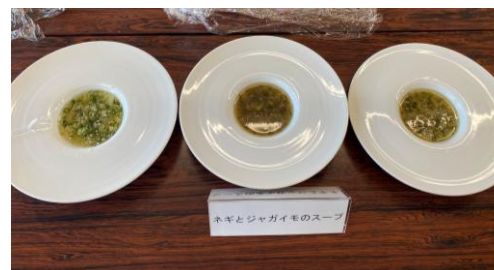
加工方法の比較 (冷凍・レトルト・フリーズドライ)