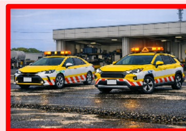
道路管理車両の電動車化