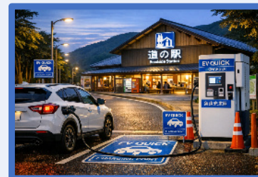
道の駅のEV急速充電器