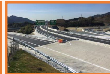
コンクリート舗装