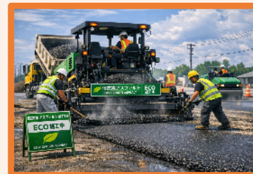
低炭素アスファルト